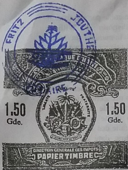
Une Gourde cinquante centimes